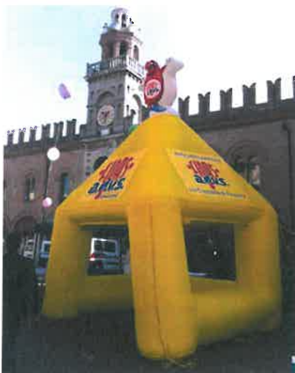
Gazebo in piazza

Intorno a questo filo conduttore si sono sviuppati tutti gli interventi dei vari presidenti che hanno presentato come di consueto le proprie problematiche, descritto i propri risultati e soprattutto avanzato proposte utili per confrontarsi e per migliorare gli aspetti della collaborazione tra i vari "livelli" dell'Associazione: in primo luogo tra le federate e il coordinamento