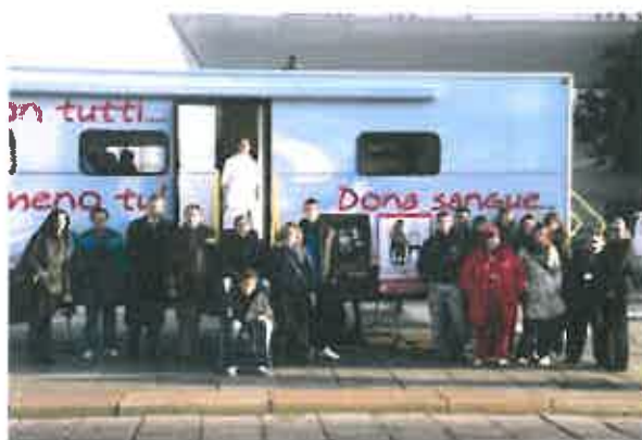
Volontari e Donatori Fidas ADSP